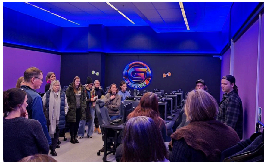
Foto del evento de cierre organizado por uno de nuestros socios noruegos, PRIOS

Participe en uno o ambos eventos contactando a su socio local.